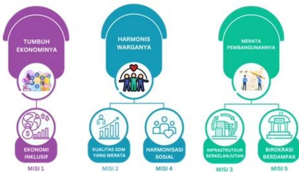
Gambar 2 Keterkaitan Tagline Visi terhadap Misi Kabupaten Lamongan Tahun 2025-2029

Sumber: RPJMD Kabupaten Lamongan Tahun 2025-2029